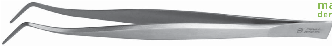
マルミ コークピンセット 16cm