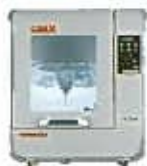
ZENITH D (セニスター) 3Dプリンター

乾式ミリングマシン ①ハイパワースピンドル搭載 ②4軸カービング方式の加工により、単冠症例 ※ を短時間で切削 ③洗練されたCAMソフトウェア「Mill Box」時間で切削