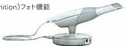
表示写真 モデルS1P ベンクリップタイプ