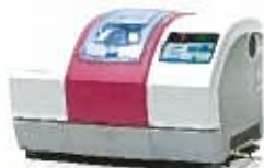
プランメカ PlanMill® 30 S