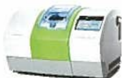
プランメカ PlanMill® 40 S