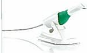
Planmeca口腔内スキャナー

小型で軽量のプランメカEmerald™口腔内スキャナーは、優れた操作性を念頭に設計されています。高速スキャンと高い精度の印象採得を可能にしたスキャナーです。デジタル印象の採得が今までになく簡単になりました！